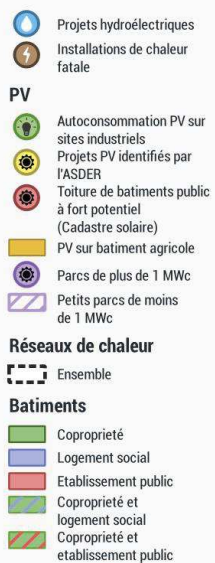
Schéma Directeur Energie